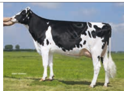
MM: Veneriete Epic Ida