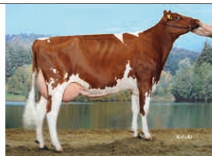
Joyboy-Halbschwester zu FH Summer: FH Sunrise Red (HLS 2016)