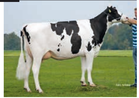
MM: Sanderij Massia Sneeuwitje