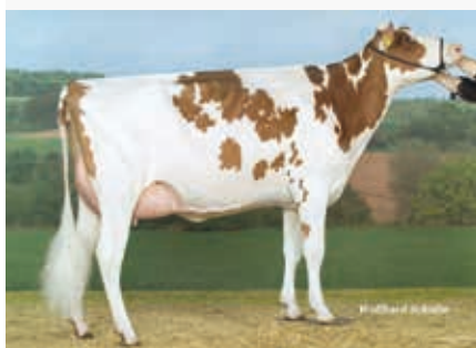
MM: Red Rose