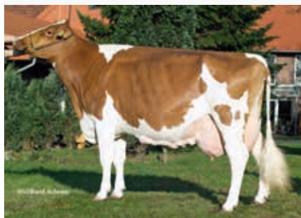
MM: FH Sheila-Red

Apple 10 889063 CVF BLF DPF BIG APPLE-RED