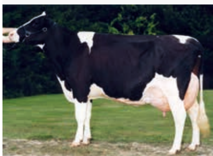
MMM: FH Skyline