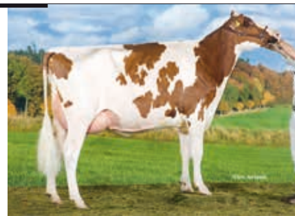
M: RZB Maryrose