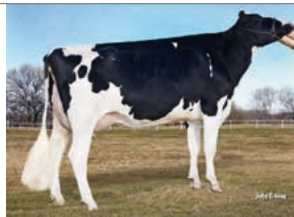
MMM: Morningview Freddie Mimi-ET