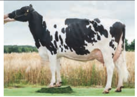
MM: WIL Kanu