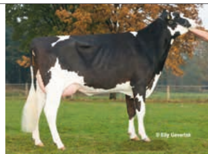
M: Karat RDC