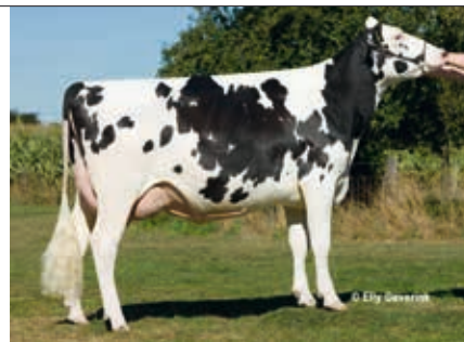
M: SHV Nevada