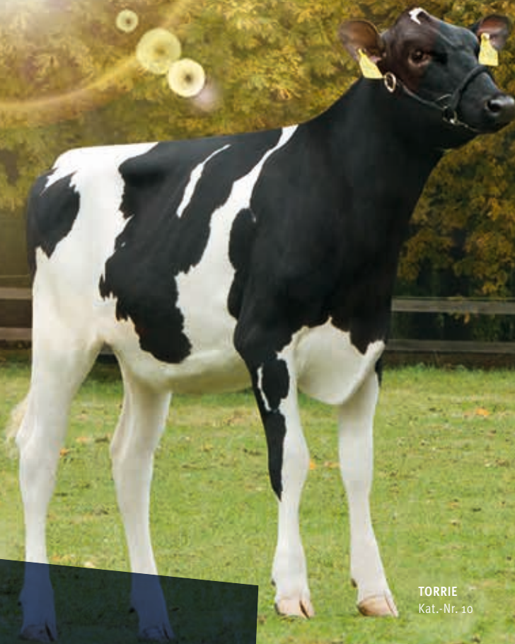
TORRIE Kat.-Nr. 10

FREITAG 6. JANUAR 2017 20:00 UHR ZENTRALHALLEN HAMM