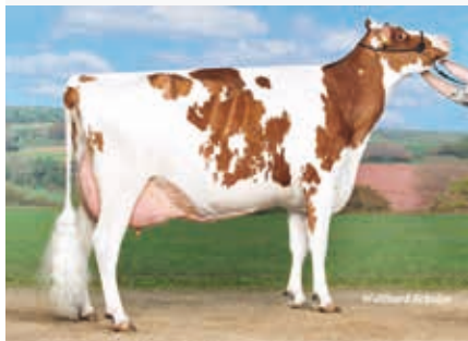
Vollschwester zur MM: Randa

Awesome 10 298284 CVC BLF DPF LUCK-E AWESOME-RED