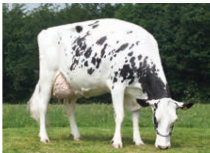
MM: Bassingthorpe Shottle Daisy

Mascalse 10 506803 CVF BLF BYF AA ZANI BOLTON MASCALESE