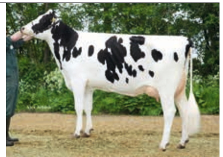
MM: Veenhuizer Nelleke