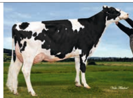
MM: Gen-I-Beq Sterling Lency

Nöhl GbR (Rinderzucht Nöhl) 54636 Idesheim