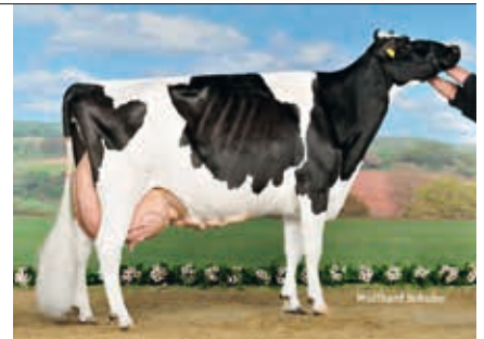
5. M: Kora (Stammkuh)

Verkäufer: Ludger Fleer Gesenhues 48599 Gronau