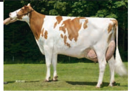
MM: SD Miss Roseanne

geboren: 07.06.2016 Verkäufer: Koester KG (Kösters) 48565 Steinfurt