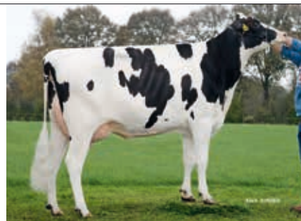
MM: VDP Leida