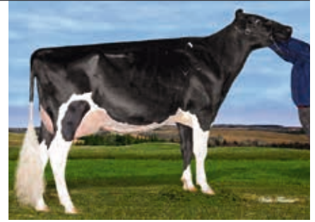
MM: Lookout Pesce Lex Perla