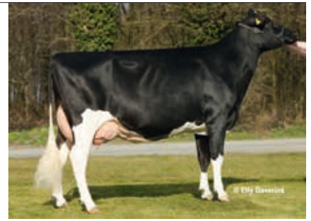
M: WR Makarena