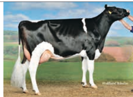
MM: WKM Ronja