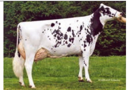
MM: Bassingthorpe Shottle Daisy