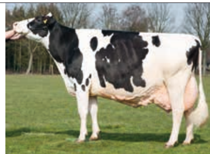
M: FH Sharon