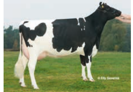
M: THI Toni