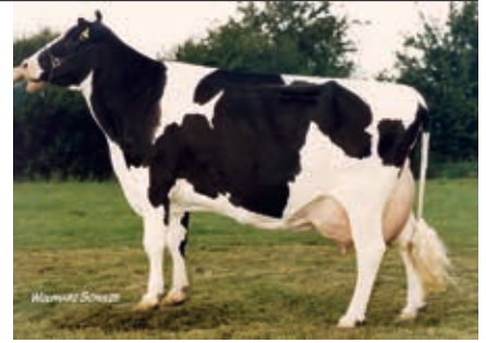
5. M: THI Hatrick EX 94 (Stammkuh)