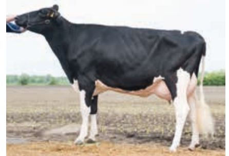
MM: WIL Meta