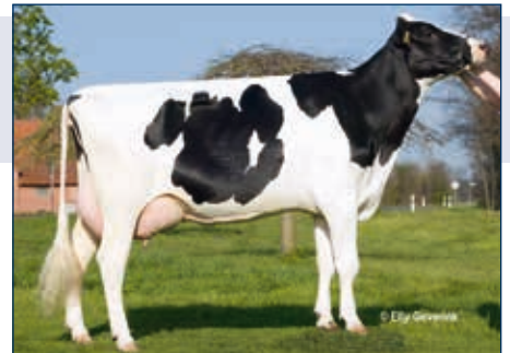
MM: WHG Maistern

Mogul 10 506694 RDF CVF BLF BYF Mountfield SSI DCY Mogul