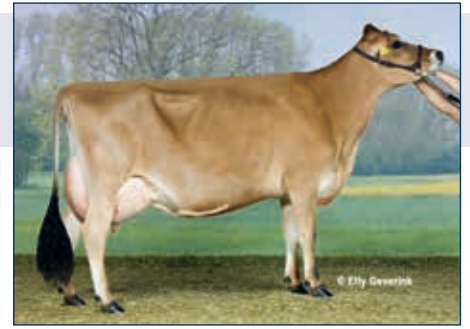
M: WS Katanga