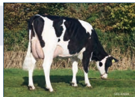
VS zur M: JK Eder Planet Malina