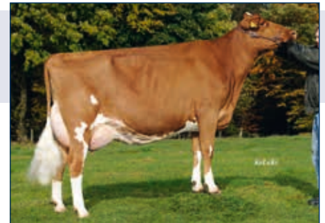
MM: WIT Gänseblume