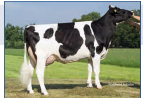
MM: HFP Queen

Schwarzbunt gZW +746 +0,03 +33 +0,07 +32 RZG 120 RZM 119 RZE 121 RZS 98 RZN 111 RZR 88