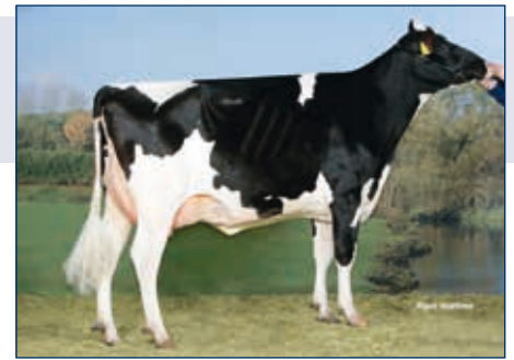
MM: Koepon Lawn Boy Claudia

PerfectAik 10 500243 RDC CVF BLF BYF FREDDY