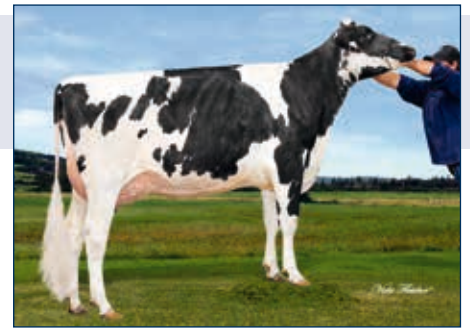
MM: Nova Garrett Edilou

Schwarzbunt gZW +1501 -0,07 +52 +0,00 +51 RZG 151 RZM 132 RZE 129 RZS 122 RZN 127 RZR 119