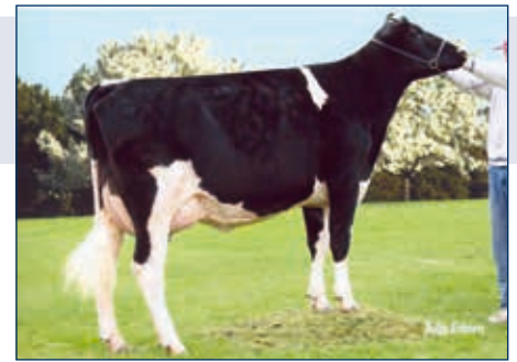
MMMM: Ralma Finley Firefly

Missouri 10 507464 CVF BLF BYF DPF VIEW-HOME DAY MISSOURI