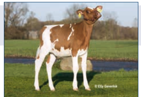
KOE Britney-Red P

Addiction 10 889288 CVF BLF MR ANSLY ADDICTION P RED