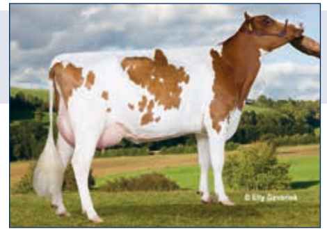
M: Maya P

Schwarzbunt gZW +590 +0,37 +60 +0,16 +36 RZG 146 RZM 126 RZE 110 RZS 120 RZN 129 RZR 125