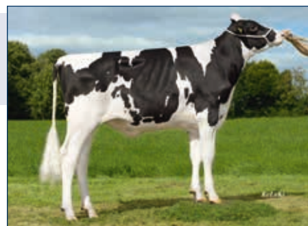
HB zur M: RUW Goldis

Schwarzbunt gZW +1417 +0,10 +67 +0,09 +58 RZG 151 RZM 138 RZE 132 RZS 122 RZN 122 RZR 103