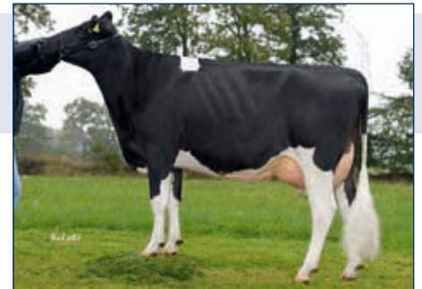
MM: HFP Quilla

Schwarzbunt gZW +1835 -0,06 +66 +0,02 +64 RZG 155 gTPI 2560 (11/15) RZM 141 RZE 129 RZS 108 RZN 127 RZR 109