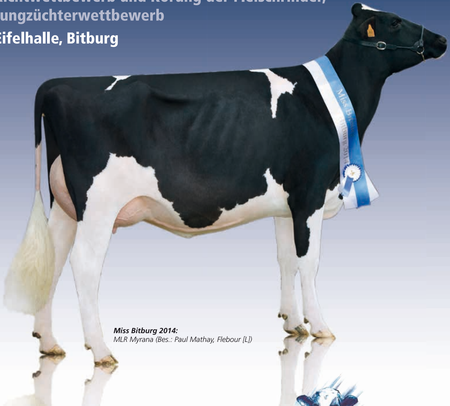
Miss Bitburg 2014: MLR Myrana (Bes.: Paul Mathay, Flebour [L])

Rinder-Union West eG Hamerner Berg 1 • 54636 Fließem • Tel.: 06569 9690-0 Fax: 06569 9690-99 • E-Mail: info@ruweg.de • www.ruweg.de