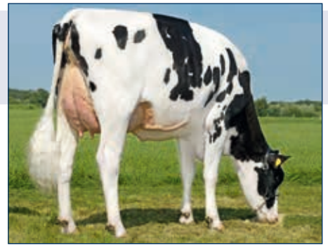
MM: RR Regatta

Missouri 10 507464 CVF BLF BYF DPF VIEW-HOME DAY MISSOURI