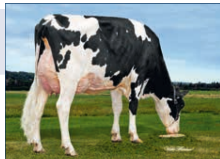
MM: GEN-I-BEQ Sterling Lency

Rotbunt gZW +1178 -0,11 +39 +0,02 +42 RZG 149 RZM 124 RZE 136 RZS 115 RZN 131 RZR 127