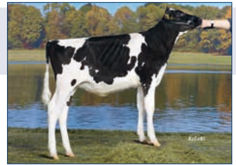
HS zur M: Wilder Marta

Schwarzbunt gZW +1167 +0,11 +58 +0,18 +58 RZG 157 gTPI 2444 (10/15) RZM 138 RZE 118 RZS 113 RZN 130 RZR 127