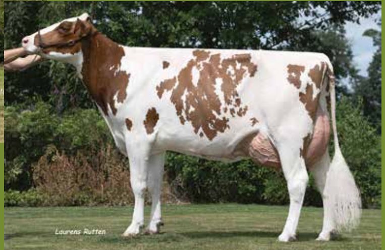
dam Annelies 11 88pt

Vaars: Annelies 18 RF BE 5 1367 1879 Jonge 1ste grade dochter met Red factor