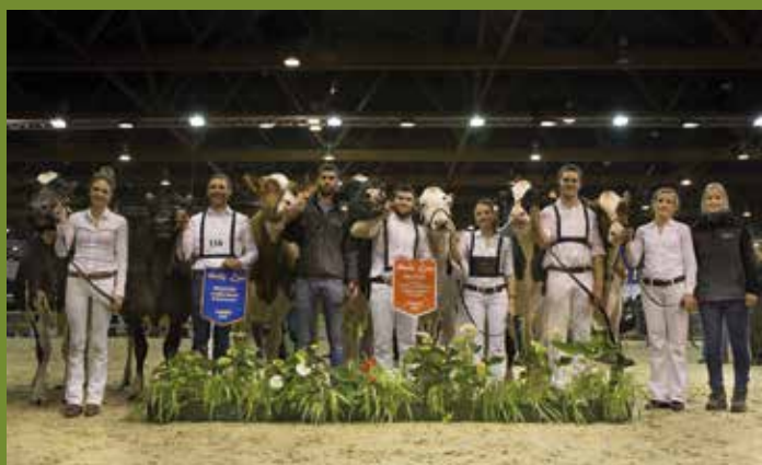
kampioenengalerij van Neuville op Agribex 2019