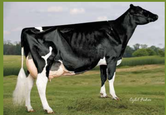
Licorice (2nd dam)

Donor: SAVAGE LEIGH GOLD LEANN BE 420461818 GEB: 04/03/2018 2 Cycle Doorman JACOBY (FEM) embryos FEM: embryo's geproduceerd met gesekst sperma