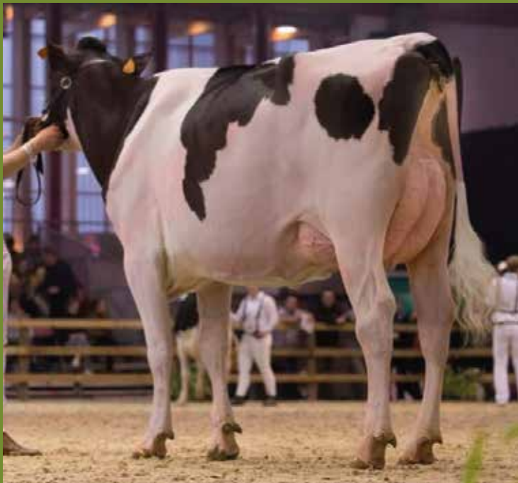
Mirza VG 88. 3e in reeks Agribex 2019

Mirza is terug drachtig en kalft opnieuw 21/07/2020 van de stier SCHREUR DG