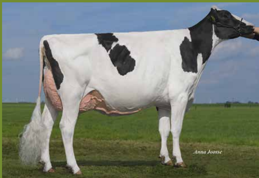
Holec Mogul Panzul VG-88