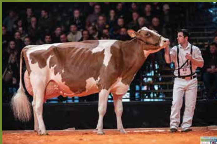
Kampioene RB Agribex 2019

De kans om de roodbonte exterieurtop van België binnen te halen. Deze combinatie herbergt de volgende nationaal kampioene.