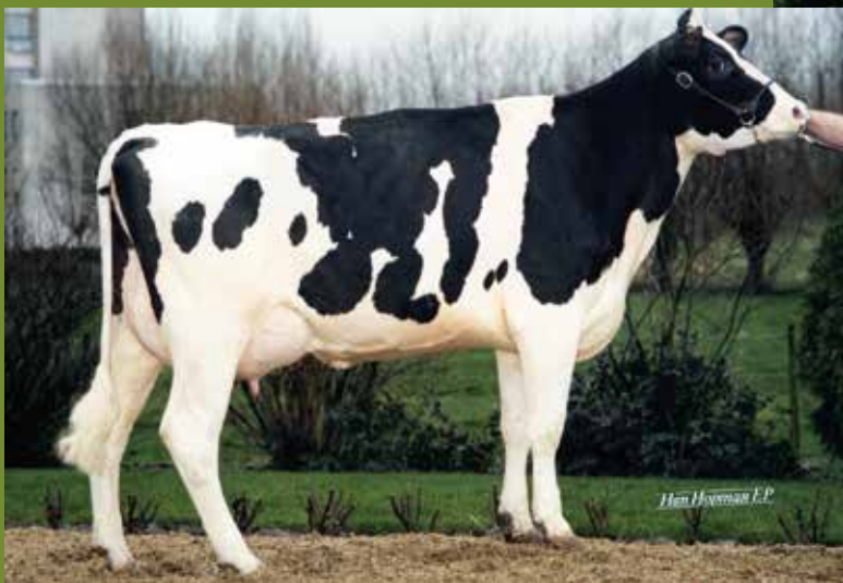
Carmine Mark Ravena B.Pop VG 89

2de moeder Indigo B.POP VG 89 (v Let It Snow) 3de moeder Genice B.POP. (v Bruno) 4de moeder Zalia B.POP. VG 89 (v Laurenzo) levensprod. 100.456 l 5de moeder Upralia B.POP. VG 89 (v Mtoto) levensprod 73. 768 l 6de moeder Ideale B.POP. VG 89 (v Blackstar) levensprod. 98.038 l 7de moeder Carmine B.POP. VG 89 (v Chief Mark) 8ste moeder Rilara Mars las Ravena EX 91