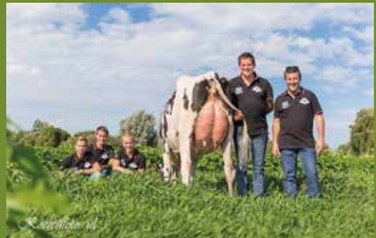
Majuscule De L'Herbagère

Sidekick x Osheik de L'Herbagere (Unix) x Majuscule de L'Herbagere (High Octane) x Gourmande de L'Herbagere (Windbrook) VG-86 x Cadette de L'Herbagere (Watha) VG-86 x OH LA LA (Capri) VG-86 x Comestar Louve Lindy (Lindy) x Comestar Laurie Sheik