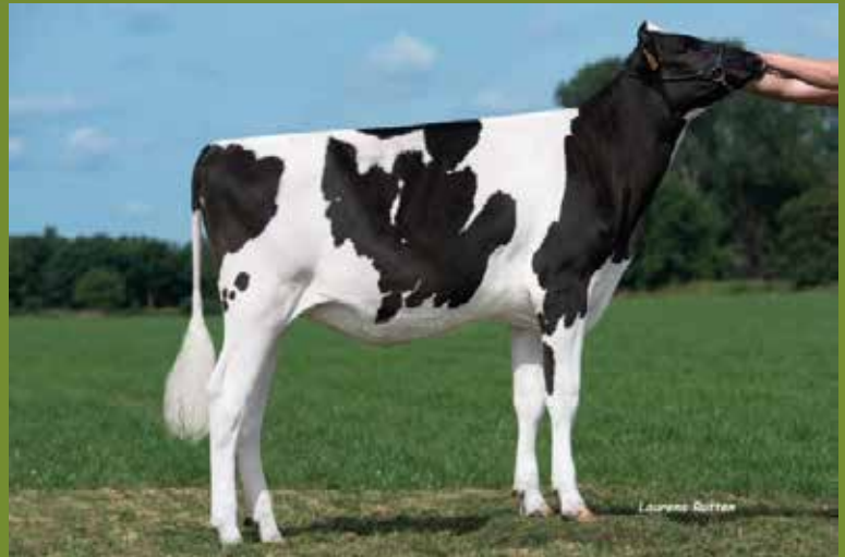
Ribiza Kampioen boogaarden 2019 Kampioen arendonck 2019 Kampioen pulderbos 2019