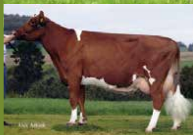
Massia 21 (4th dam)

VAARS: Atwood Minny BE 320531763 GEB: 06/12/2017