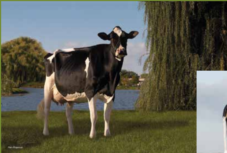
Durham Debutante Rae EX-92