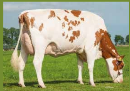
Future Dream Debu Red (2nd dam)

VAARS: Barb Divine-RC BE 418252044 GEB: 20/04/2019