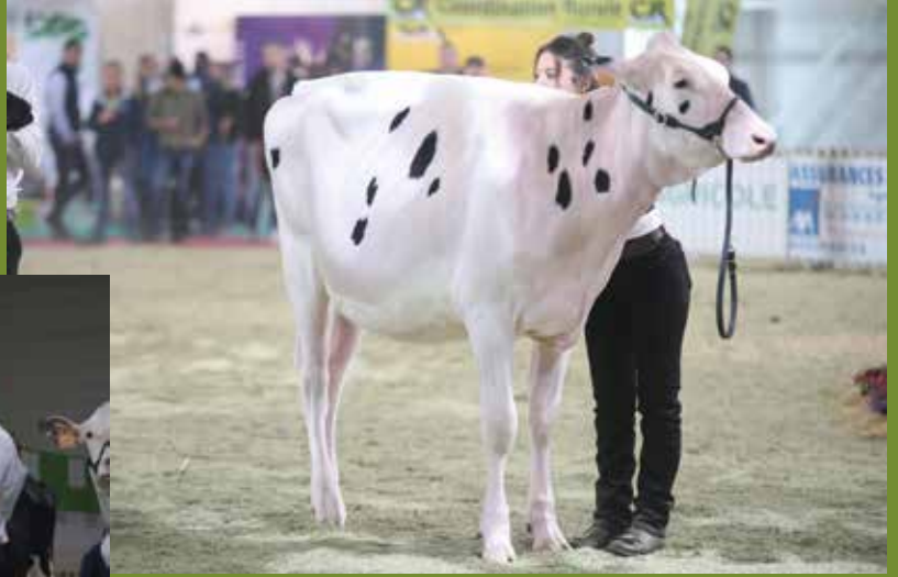
Hautmont Hill Dempsey Danish