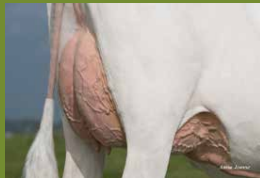
Holec Kingboy Palmas VG-87