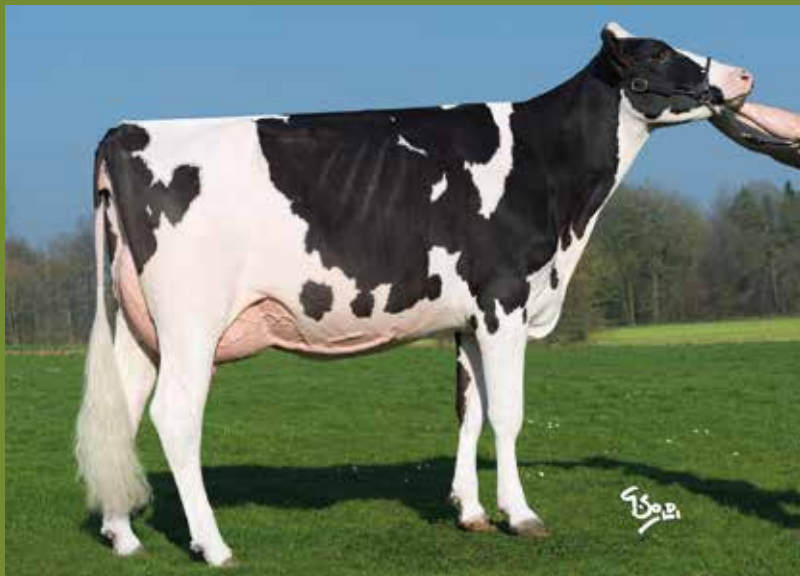
Gourmande De L'Herbagère