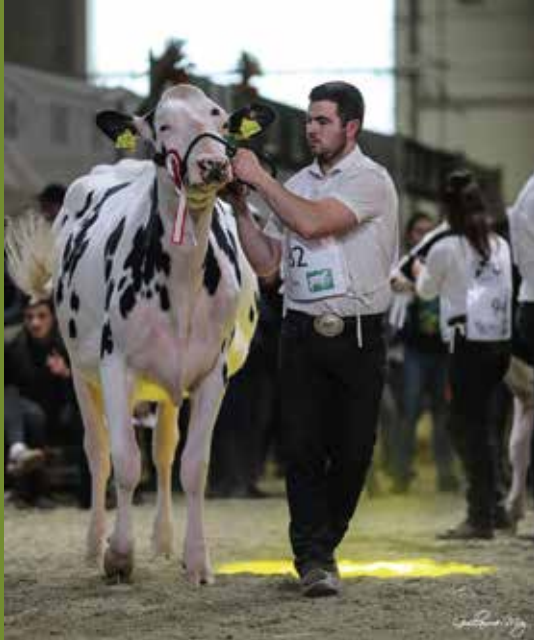
Kampioene ongekalfde vaarzen Agribex 2019 + Championne Open Show Génisses Metz 2019