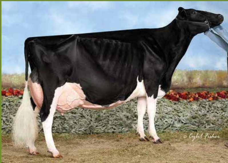
Savage Leigh Leona EX-96 (Same family)

2 embryos Cycle Doorman Jacoby (FEM) x Savage Leigh Gold Leann