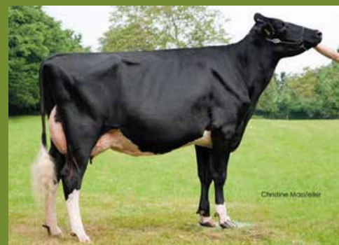
Maya ET(2nd dam)