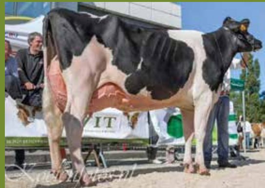
Moeder Jirza VG 89 MS 90

Mirza is terug drachtig en kalft opnieuw 21/07/2020 van de stier SCHREUR DG