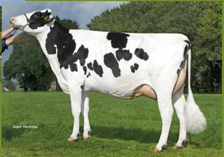
ALH Delta Modest 2y VG-85

Donor: NICOLA-ET v/h ZOMERBLOEMHOF 0983 Genomics: US 12-19 +1047M +29F +47P GTPI.2422 PTAT +2.17 UDC +2.44 PL +5.8 DPR +2.6 SCS +2.68 NLD: 1126M +0.17%V +0.12 %E 341 GNV I 762LVD 102F 111U 104B 109TOT 106UGH 109CGT 109VRU * Hoge GNV I/GTPI Bubba uit de Modesto Familie * Gesekste Embryo's van TWITCH (2877GTPI top HELIX zoon)