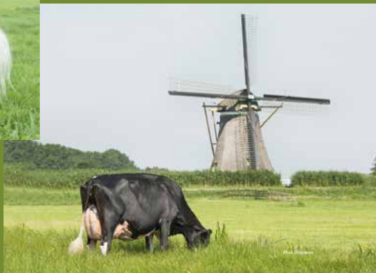
Bons-Holsteins Koba 191