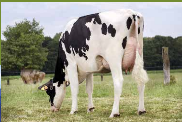
Kemdale Cinderella 2 (moeder van Kemdale Callboy bij KI De Toekomst)

Donor: KEMDALE CINDERELLA 3 VG-86 BE 5 1320 8270 Geb. 13/08/2017 3 GOLDWYN embryo's