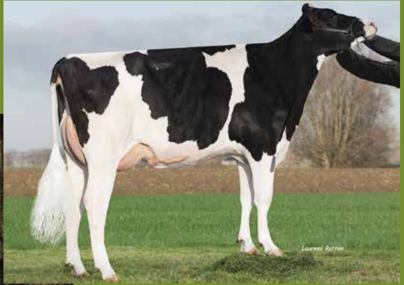
Kaylee-ET v/h Zomerbloemhof VG-88