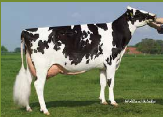
Rr Rieka EX 90