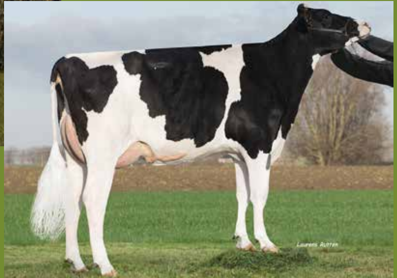
Kaylee-ET vh Zomerbloemhof VG-88

VAARS: Miley Cyrus-ET v/h ZOMERBLOEMHOF 0803 Gek: 27/10/19 en op 9/1/20 ins met Aristocrat gesekst! NLD: 1093M +0.33%V -0.03 %E 249 GNVI 539LVD 104F 114U 97B 108TOT 105UGH 109CGT 107VRU * Ext: 84F 86T 86U 82B 84Tot * 38kg melk 6.12V 3.58E 86celgetal * Mooie flagship uit de Roxy Familie * Afst van Scientific Debutante Rae EX-92 (10gen EX op ...)