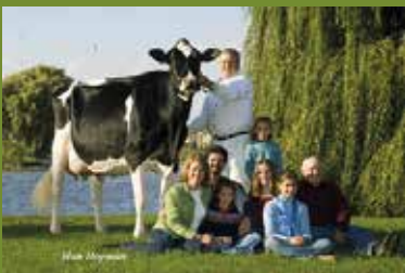
Scientific Debutante Rae RC (4th dam)