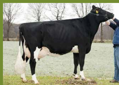
Massia 102 (3rd dam)