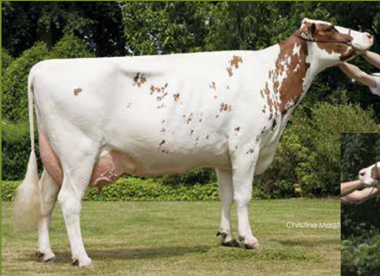
2e dam Annelies 45 EX 91