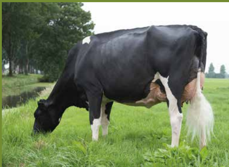
Koba 209 EX-91 moeder van de embryo's