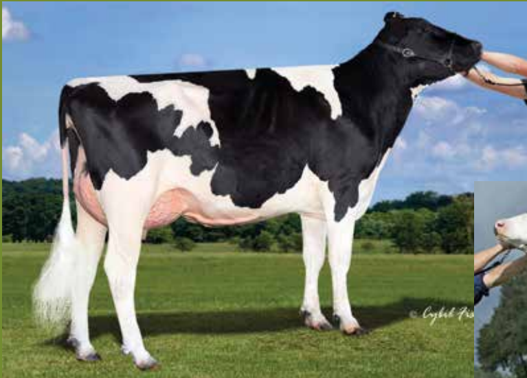
S-S-I Supersire Miri VG-89

3 Mr Farnear Helix Twitch +2877GTPI & +2.36PTAT (FEM) embryo's uit Nicola-ET, hoge bubba pink uit bookem Modesto