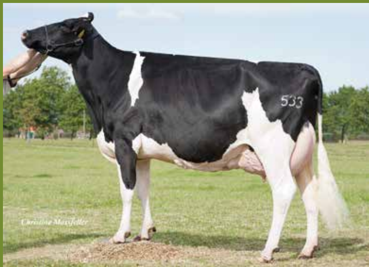
Eurostar Goldwyn Beauty