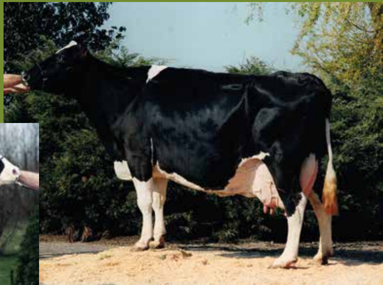
Ideale-ET B.Pop VG-89 FOTO bij 98.000L

Deze koefamilie staat garant voor topexterieur en hoge levensproducties.