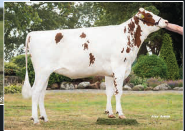
K&L SV Sunny Red Mutter Dam