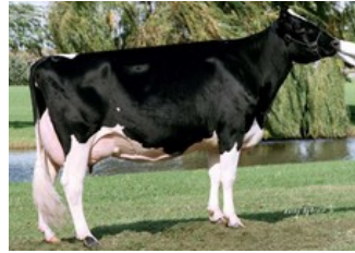
Snow-N Denises Dellia