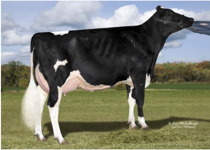
Cookiecutter MOM Halo