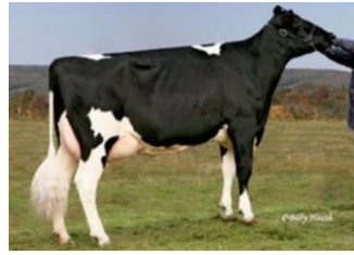
Cookiecutter GLD Holler