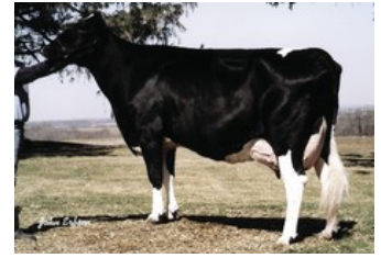
Long-Haven Rudolph Dee