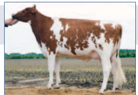
M: HWH Liza

gZW +1458 -0,23 +40 -0,19 +32 RZG 130 RZM 110 RZE 134 RZS 115 RZN 124 RZR 104