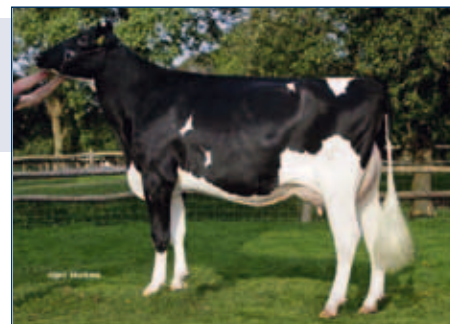
MM: Bouw Goldwyn Femmy

Schwarzbunt gZW +1421 -0,35 +22 +0,06 +54 RZG 141 RZM 124 RZE 127 RZS 124 RZN 126 RZR 106