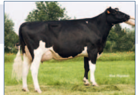
MMM: Dukefarm Malina

Schwarzbunt gZW +1754 +0,09 +82 +0,07 +67 RZG 158 RZM 139 RZE 121 RZS 108 RZN 136 RZR 113