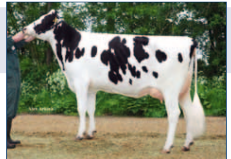
MM: Veenhuizer Nelleke

Schwarzbunt gZW +1657 -0,08 +60 +0,09 +66 RZG 150 RZM 136 RZE 121 RZS 113 RZN 128 RZR 106