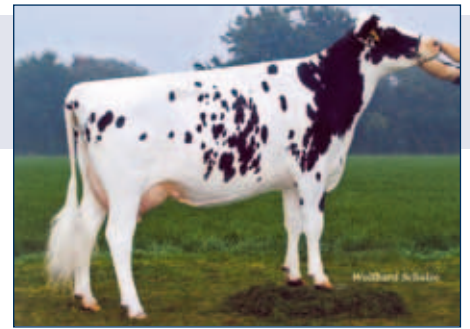
Halbschwester zur MMM: Simone

Schwarzbunt gZW +1955 -0,29 +48 +0,10 +77 RZG 155 RZM 141 RZE 119 RZS 114 RZN 130 RZR 114