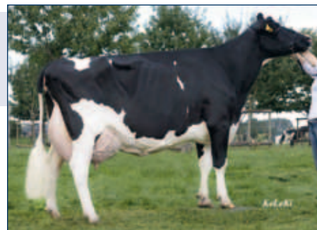
MM: THI Blacktalent