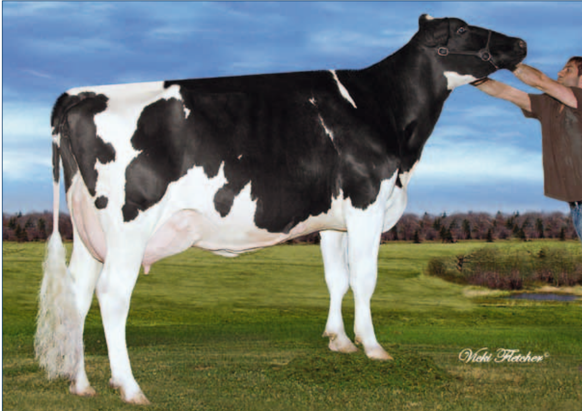
MMM: Charpentier FBI Sierra

gZW +861 -0,09 +28 +0,18 +45 RZG 132 RZM 118 RZE 114 RZS 115 RZN 123 RZR 114