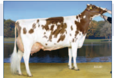
MM: HMS Arabella

Rotbunt gZW +1811 -0,04 +72 +0,07 +69 RZG 155 RZM 137 RZE 132 RZS 120 RZN 134 RZR 99