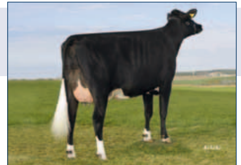
MM: PM Cartina

Schwarzbunt gZW +2609 -0,15 +90 -0,09 +78 RZG 151 RZM 146 RZE 133 RZS 103 RZN 118 RZR 96