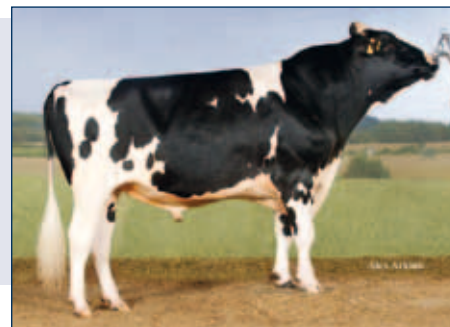
Vollbruder zur MM: Elenus

Schwarzbunt gZW +2511 -0,24 +76 -0,03 +81 RZG 161 RZM 146 RZE 121 RZS 116 RZN 137 RZR 105