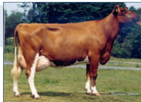
MM: WR Morelle

Rotbunt gZW +265 +0,61 +60 +0,29 +32 RZG 140 RZM 116 RZE 120 RZS 129 RZN 131 RZR 121