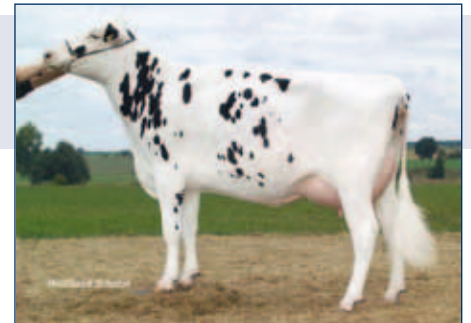
MM: CNN Dream

Schwarzbunt gZW +1409 -0,18 +39 +0,01 +49 RZG 156 RZM 123 RZE 144 RZS 131 RZN 144 RZR 114