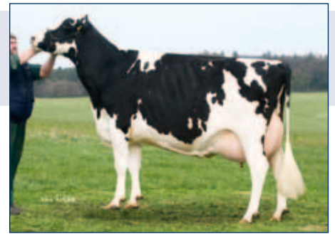
Vollschwester zur MMM: RZG Urelia