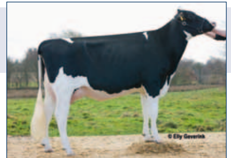
MM: XY-Ting Candy

gZW +1929 -0,16 +62 +0,05 +71 RZG 154 RZM 139 RZE 123 RZS 114 RZN 129 RZR 115