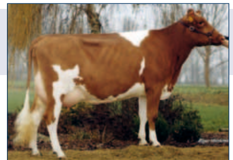
MMMM: Almere Pietje 514