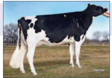
MM: Morningview Freddie Mimi-ET

Schwarzbunt gZW +1350 -0,03 +52 +0,12 +58 RZG 161 RZM 130 RZE 135 RZS 124 RZN 145 RZR 123