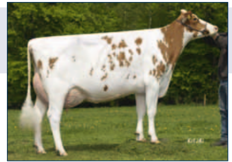
M: WIT Aklasse