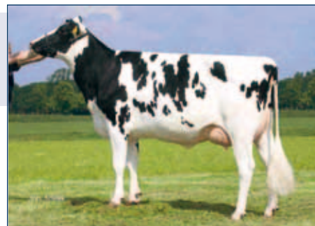
M: Kossinkhoeve Zadia

Schwarzbunt gZW +1787 -0,01 +72 +0,01 +62 RZG 150 RZM 135 RZE 123 RZS 109 RZN 130 RZR 111