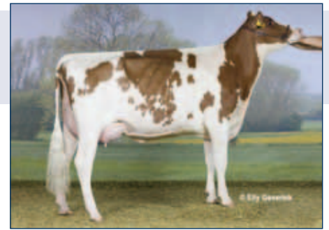
M: KOE Tilly

Rotbunt gZW +1467 -0,57 +8 +0,12 +61 RZG 149 RZM 124 RZE 122 RZS 131 RZN 134 RZR 120