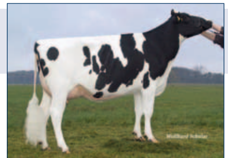
M: CNN Dana

Schwarzbunt gZW +1419 -0,01 +57 +0,07 +56 RZG 148 RZM 129 RZE 127 RZS 125 RZN 131 RZR 106