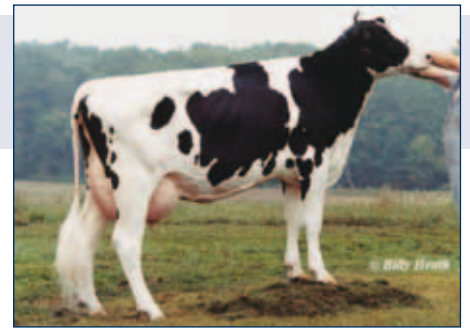
MMM: Welcome Outside Golden

Schwarzbunt gZW +2297 -0,13 +79 +0,00 +78 RZG 150 RZM 145 RZE 109 RZS 102 RZN 115 RZR 122