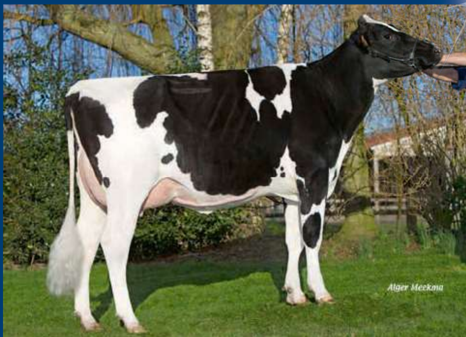
MMM: Roccafarm Beacon Chrissy VG-87