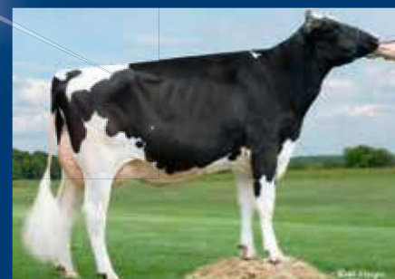
MMMM: Larcrest Chenile VG-86