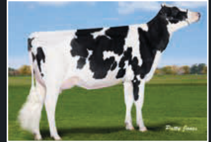
Gen-I-Beq Snowman Summer VG 85 4. Mutter 4 th dam