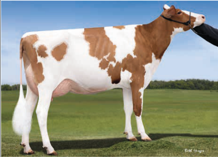
Snowbiz Sympatico Sofia VG 85 Ur-Großmutter 3 rd dam