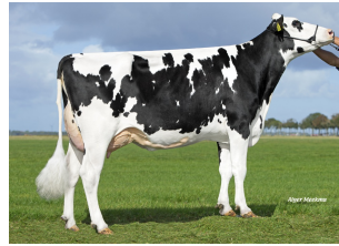
Midwolder Marjon 137 VG-86