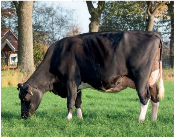
Big Anna Jacoba 153 EX-90