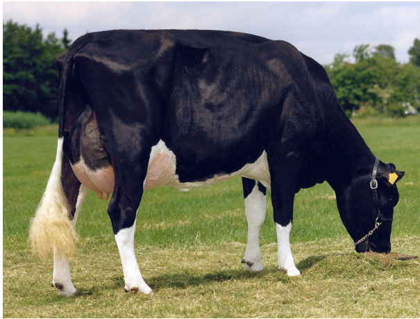
AZ Lena 191 VG-89 (v. Lord Lily)