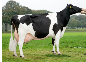
Big Anna Jacoba 119; Big Winner half-sister to