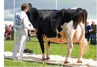
AZ Lena 411 EX-90 (v. Dempsey)

Laatste MPR : 28.7 kg melk, 3.82% vet & 3.65% eiwit, celgetal 10.