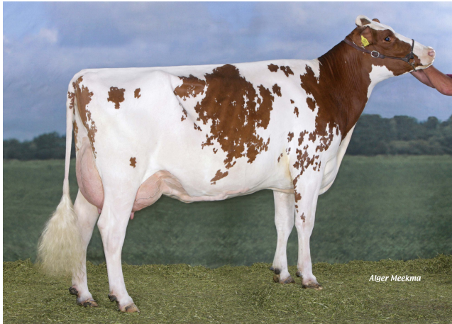
Molenkamp Grietje 48 VG-86