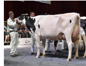
AZ Lena 486 EX-92 (v. McCutchen), NRM 2019