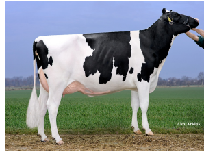
Drouner AJDH Aiko RDC VG-87