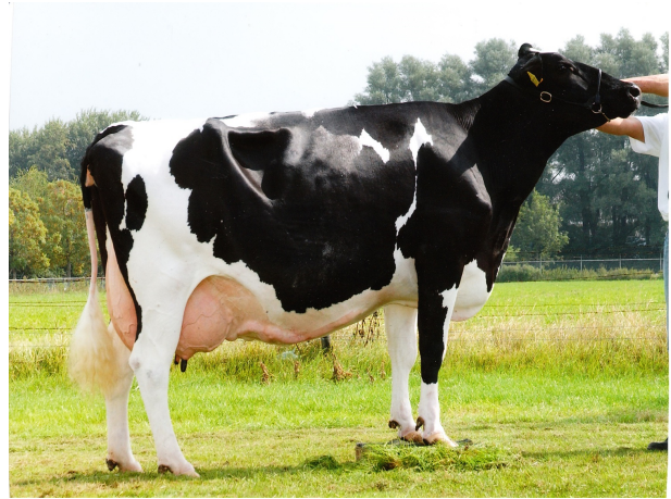
Hoftijzer Holsteins Jolt Bea 63 EX-90

Laatste MPR : 30.1 kg melk, 4.50% vet & 3.43% eiwit, celgetal 21.