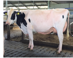
AZ Lena 486 EX-92 (v. McCutchen)