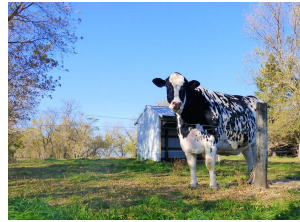
Larcrest Cosmopolitan VG-87