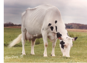
D-R-A August EX-96

Laatste MPR (10-12) : 38.6 kg melk, 3.55% vet & 3.36% eiwit, celgetal 4.