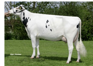
Boon-Apart ALH Asra VG-86