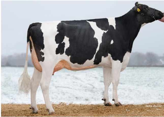
Apina Nadja 143 VG-88