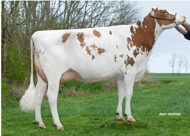
Koepon Slvtr Sanne 8 Red VG-88