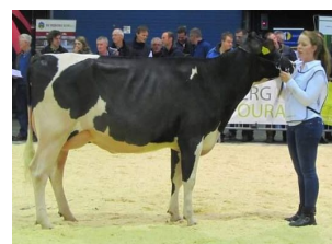
De Wijde Blik Trian Jolein 2 (v. Danillo)