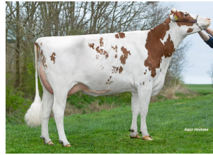
Lakeside UPS Red Range VG-86