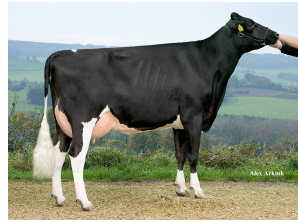
Apina Nadja 4 VG-85