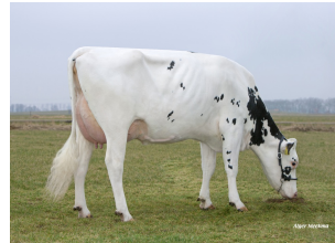
Veneriete Ida 31 VG-87