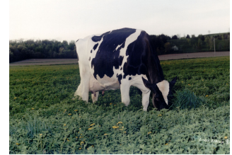
Golden-Oaks Mark Prudence EX-95

Lakeside UPS Red Range-Red VG-86 is onlangs verkozen tot "Global Red Impact Cow 2021", 's werelds meest invloedrijde stiermoeder, vanwege haar 16 zonen bij de KI, including de Canadese gLPI aanvoerder 3STAR OH Ranger-Red!