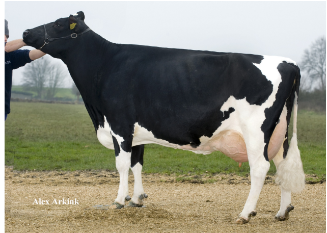
Molenkamp Grietje 28 RDC VG-87

Laatste MPR : 39.7 kg melk, 4.53% vet & 3.74% eiwit, celgetal 11.