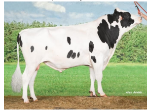
Apina Malcolm RF VG-85