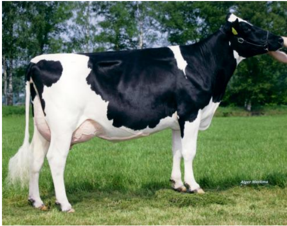
Big Super Star 32 VG-85