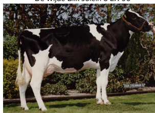
Broeks Janna 738 VG-88