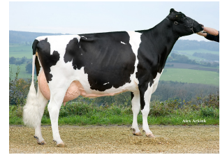
Apina Nadja EX-90