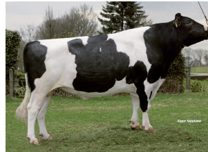
Big Winner, Win 395 x Big Super Star 25 EX-90