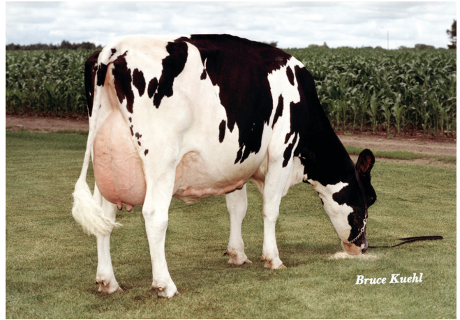
Ralma Juror Faith EX-91