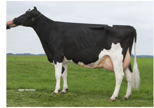
Midwolder Marjon 15 VG-87