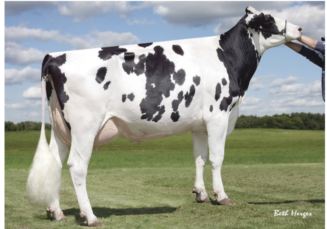
Sully Shottle May EX-91

Laatste MPR : 36.5 kg melk, 4.27% vet & 3.34% eiwit, celgetal 17.