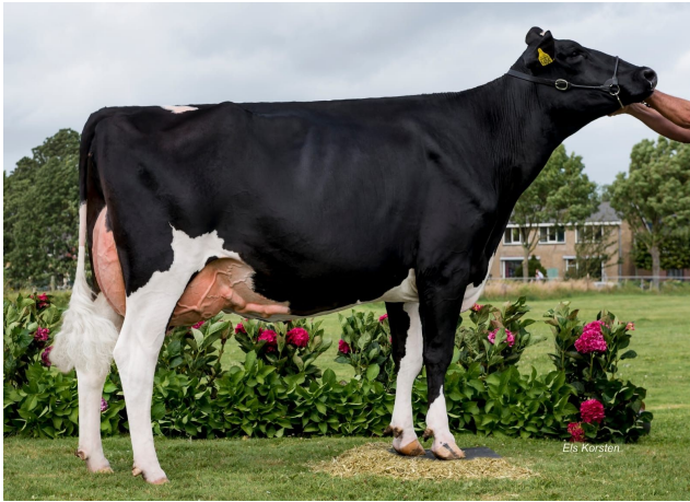
Hoftijzer Holsteins Dempsey Bea 176 EX-91