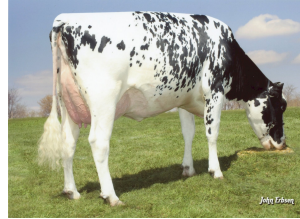
Larcrest Cosmopolitan VG-87