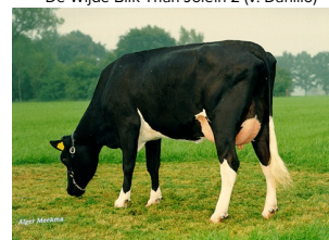
Janna 858 VG-88

Jolien 12 is recent als verse vaars ingeschreven met AV 85 en 86 uier!