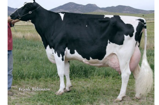
Canyon-Breeze Strm Ashes EX-90

Laatste MPR (10-12): 34.2 kg melk, 3.53% vet & 3.19% eiwit, celgetal 8.