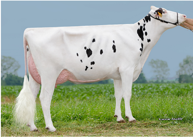
Mirabel Sound System-dochter