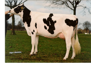
Southland Dellia 2 VG-88

Laatste MPR : 44.5 kg melk, 3.87% vet & 3.55% eiwit, celgetal 146.