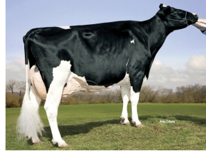
Kamps-Hollow Durham Altitude EX-95