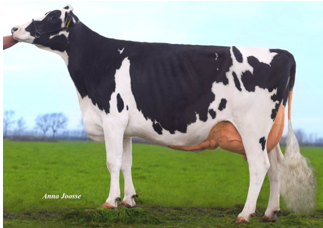
Veneriete Epic Ida 66 VG-88