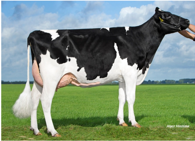
Midwolder Marjon 168 GP-84