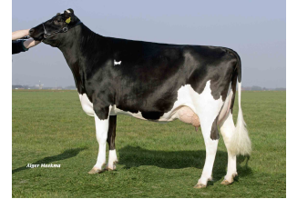
Midwolder Marjon VG-87

Laatste MPR : 42.1 kg melk, 3.98% vet & 3.42% eiwit, celgetal 9.