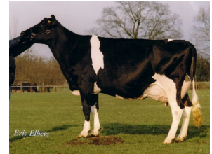
Big Super Star 25 EX-90