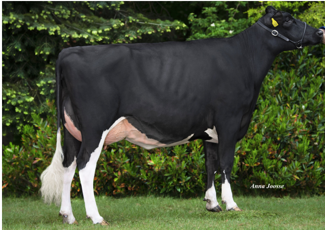
Krol Otina 2886 VG-89, volle zus van Krol Otina 2975 VG-88

Kalfdatum : 11-11-2021 (vers, nu 3e kalfs)