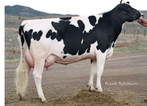
Canyon-Breeze Mar Addison VG-85