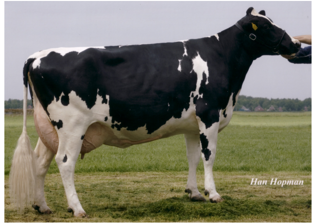
Drouner Mientje 698

Laatste MPR (10-12) : 28.9 kg melk, 3.81% vet & 3.56% eiwit, celgetal 18.