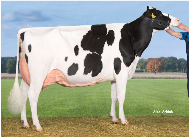
Drouner AJDH Cosmo 4e lact. EX-91