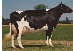
AZ Lena 168 VG-89 (v. Sunny Boy)