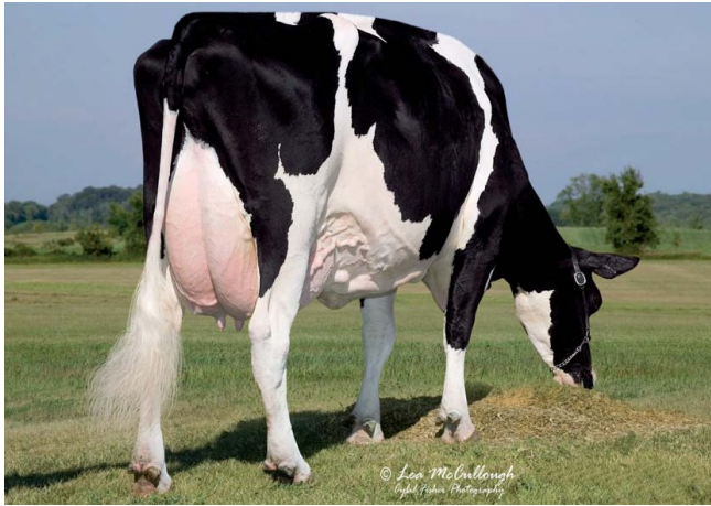
Ralma Durham Fireball EX-92 (Durham x Faith EX-91)