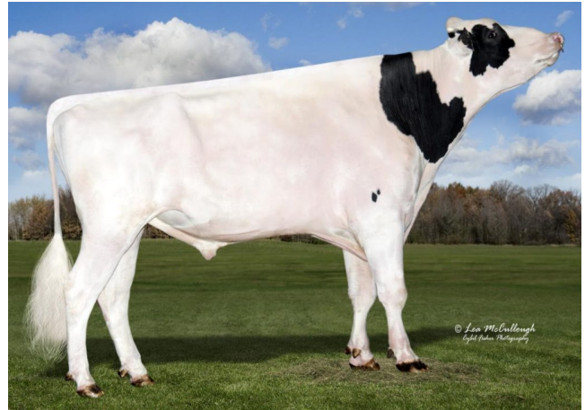
OCD McCutchen Durango RF

Laatste MPR : 41.5 kg melk, 3.49% vet & 3.30% eiwit, celgetal 40.