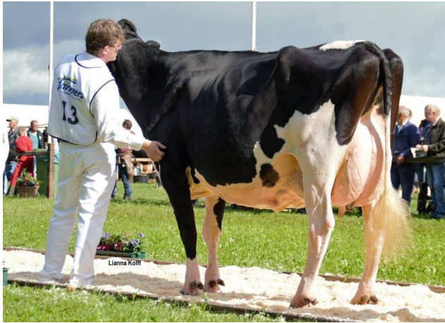
AZ Lena 411 EX-90 (v. Dempsey)