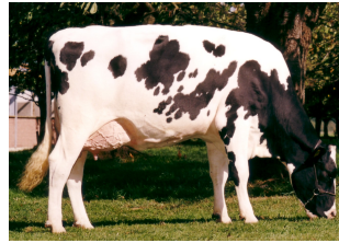
AZ Lena 220 EX-90 (v. Jocko)