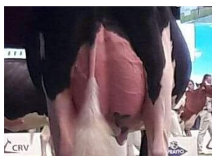
De Wijde Blik Jolein 5 EX-90