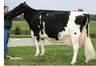
Larcrest Juror Chanel EX-93

Laatste MPR (10-12): 34.7 kg melk, 3.01% vet & 2.73% eiwit, celgetal 11.