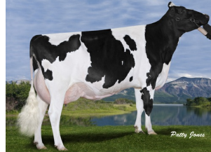
Gen-I-Beq Goldwyn Secret RC VG-87