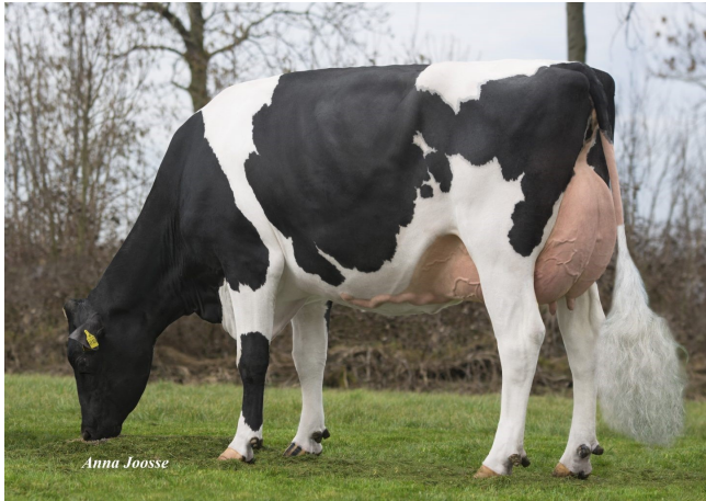
PG De-Su Commander 9026 VG-85