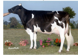
Bersaglio Mtoto Locanda VG-87

Schitterende vaars uit de Nadja's (A2A2 en BB).