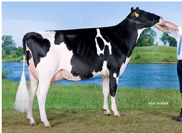
Drouner Asra 1130 EX-90