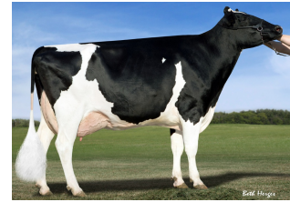
KHW Goldwyn Aiko RDC EX-91