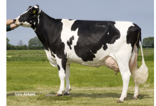
Butemare Veneriete Ida O VG-86

Laatste MPR : 45.6 kg melk, 3.78% vet & 3.28% eiwit, celgetal 29.