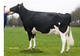
Manders Dellia 1 VG-87