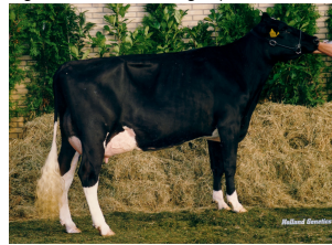
Big Pinkpop Star 5 EX-90