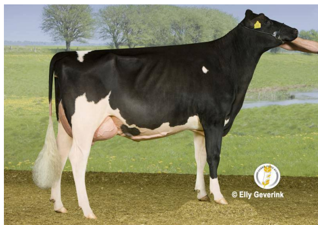
De Wijde Blik Jolein 5 EX-90