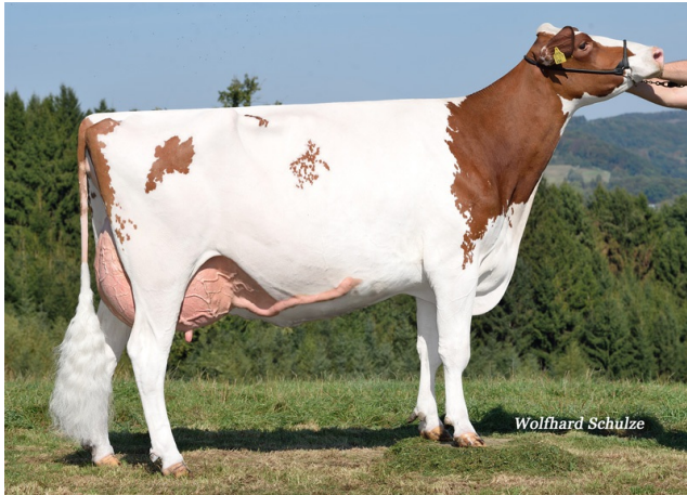
OCD McCutchen Durango RF-dochter