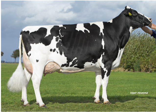
Midwolder Marjon 53 VG-87