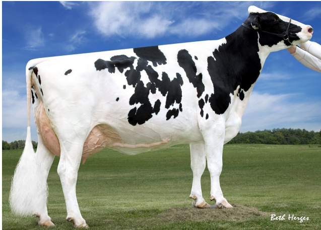
Morningview Shtl Alana EX-92