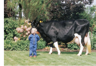
Big Anna Jacoba 71 VG-88

Familie van de fokstier Big Malki: de moeder is een halfzus van Big Malki!