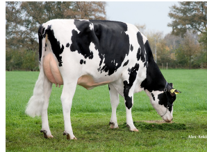
Manders Dellia 8 GP-84