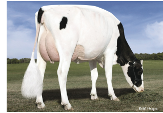
Des-Y-Gen Planet Silk EX-90