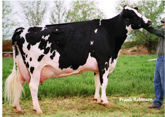
Canyon-Breeze EM August ET EX-92

Laatste MPR : 39.3 kg melk, 3.84% vet & 3.28% eiwit, celgetal 6.