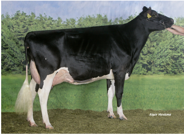
Big Anna Jacoba 115 EX-90

Kalfdatum: 09-12-2021 (net vers, nu 2e kalfs!)