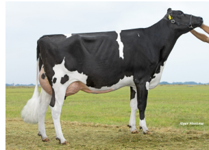
Midwolder Marjon 109 VG-85 VG-85