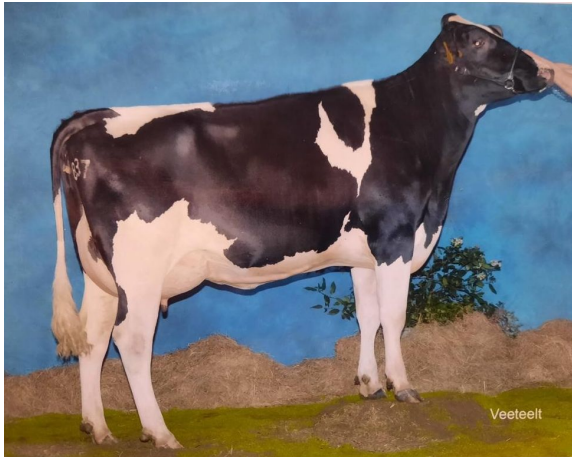
James Beppie 124 VG-89