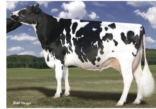
Larcrest Outside Champagne EX-90