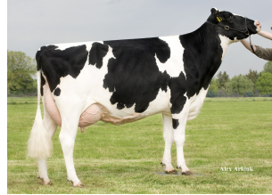
Holbra Mascol Pam VG-87