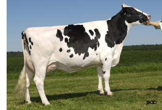
Glen Drummond Splendor VG-86

Koepon Salvatore Sanne 8 Red VG-88 is de volle zus van Koepon AltaTop-Red, die veelvuldig als stiervader is ingezet.