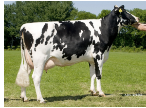
Delta Jakorien VG-86