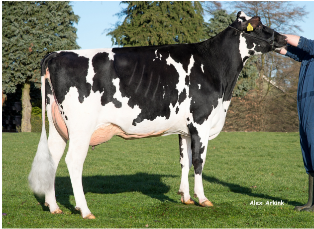
K&L PL Dellia 6538 VG-87