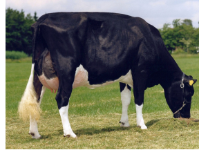
AZ Lena 191 VG-89 (v. Lord Lily)