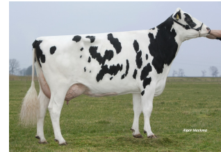
Veneriete Shottle Ida 6 VG-88