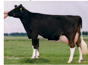
Big Etazon Blackstar VG-89

Koefamilie met enorm veel duurzaamheid en levensproductie! Vele stieren uit deze familie bij de KI, waaronder Big Winner, Big Redstar, Big Festino-Red en Big Surprise RF. Dubbel "Big" fokproduct: De Big Anna Jacoba's aan vaderskant en de Big Super Stars aan moederskant!