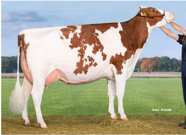
Drouner AJDH Aiko 1288 Red EX-91