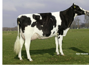
Southland Dellia 44 EX-90