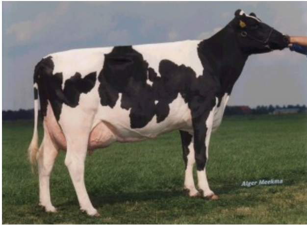
Drouner Mientje 552