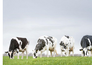
Venerieta Ida familie - Ida O - Ida 6 - Ida 31 - Ida