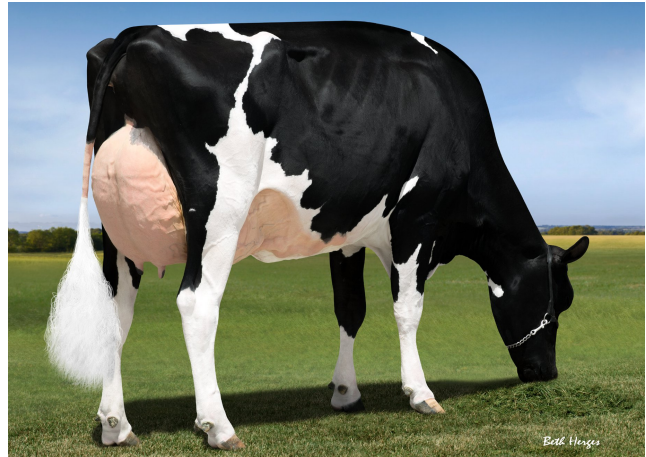
Moeder van Tango Rad

Fraaie, best geuierde koe met hele beste benen!