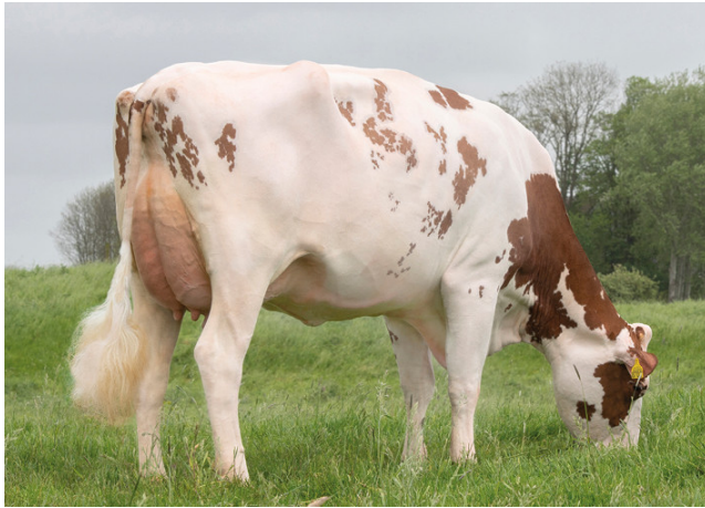
Lakeside Ups Red Range VG-86