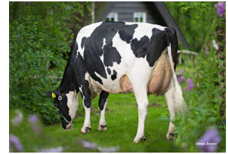
De Oosterhof Dg Rose RDC VG-89