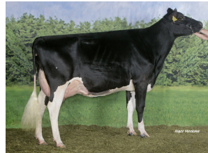
Big Anna Jacoba 115 EX-90