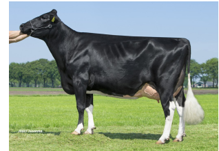
Big Anna Jacoba 126 EX-90