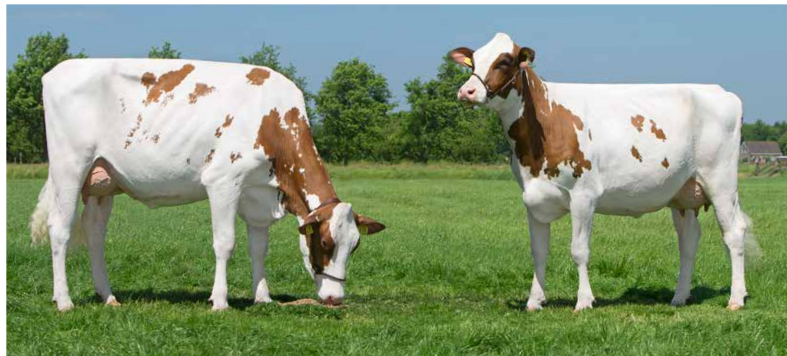
Twee halfzusjes uit stammoeder Caudumer Lol 292: links Caudumer Lol 303 (v. Mitey P) en rechts Caudumer Lol 305 (v. Magna P)

Uit Lol 306 melkt Hermanussen Jestervaars Lol 7052, die afgelopen winter won bij de vaarzen in Asten-Heusden. En ook die produceert met 11.000 liter en 116 lactatiewaarde goed.