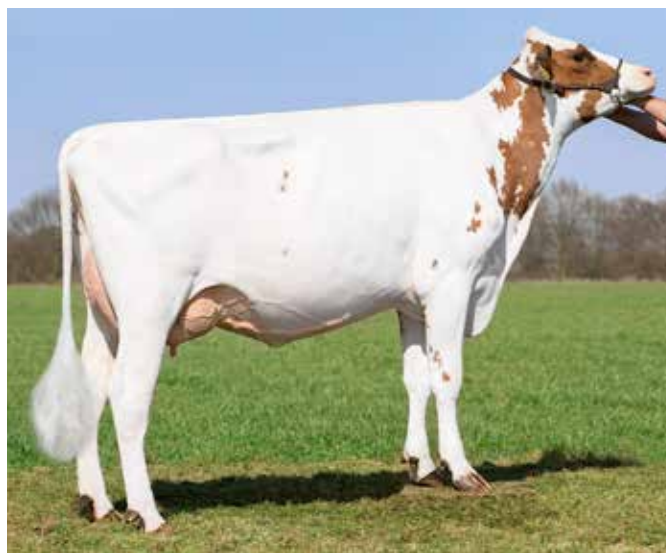
Barendonk Lol 7052 (v. Jester) haalde haar eerste keuringssucces al binnen