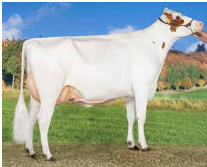
De excellente Caudumer Lol 306 slaagde met vlag en wimpel op Delta-testbedrijf Hermanussen

Een van die stieren is Fun P. Als genoomstier is hij al flink benut, maar zijn dochters laten zijn fokwaarde nog verder stijgen. ‘Zijn eerste 74 dochters zijn gemiddeld met 83,2 punten ingeschreven. Dat is bizar hoog. Ik kan me geen stier herinneren die zo’n hoog gemiddelde noteerde’, aldus Fox. ‘Hij fokt heel fraaie, opengebouwde vaarzen met beste benen en super uiers. In openheid en inhoud brengt deze stier echt even wat extra’s.’ Het nadeel van Fun is het eiwitgehalte. ‘Dat zal een heel breed gebruik wel in de weg staan. Maar we werken op dit moment in Wirdum met een hoornloze Concertpink met roodfactor uit de familie die +0,21% eiwit noteert in haar fokwaarde. Binnen twee generaties kan die lijn in een familie dus weer heel anders zijn.’ De fokkerijkenners zijn het erover eens dat Lol 292 een sleutelrol in de familie heeft gespeeld. ‘Hoornloosheid heeft alles in deze familie veranderd. Daarnaast was Lol 292 een heel complete en fraai uitgebalanceerde koe. Zulke balansrijke dieren blijken ook vaak de beste fokkoeien. Dat heeft de familie inmiddels wel duidelijk bewezen’, zo vertelt Van der Boom. ‘En,’ zo vult Fox aan, ‘daarmee heeft deze familie in sneltreinvaart hoornloosheid in de top van de indexlijsten gebracht.’