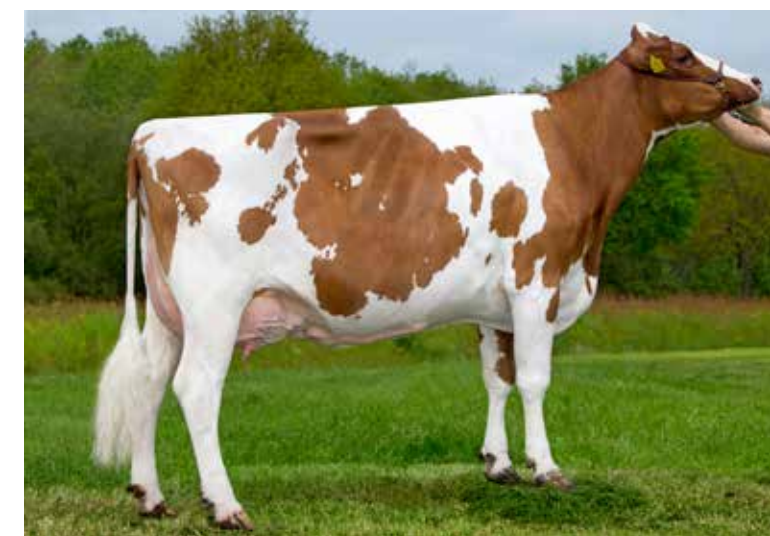
Stammoeder Caudumer Lol 292 heeft hoornloosheid in de koefamilie gebracht

Wat CRV op Terwispel met Lol 306 deed, deed Haytema in Koudum met volle zus Lol 305. Dat leverde onder andere de nu hoge Duitse stier Smile P op. De Lol-familie breidde zich door de foktechnische belangstelling vervolgens razendsnel uit. 'Op dit moment stamt wel 60 procent van ons jongvee uit deze familie', vertelt Haytema. 'Dat is niet erg, want de Lollen zijn gemiddeld genomen niet al te grote, laatrijpe koeien met altijd een superbeste uier, zeker in achteruierhoogte. Ook in productie doen ze het altijd bovengemiddeld goed.'