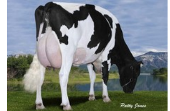
Gen-I-Beq Goldwyn Secret RC VG-87

Skat P RDC x Augustus P Red x VG-85 AltaDateline x GP-84 Salvatore Rc x Rubicon x GP-83 Cashcoin x VG-87 Snowman x EX-90 Planet x VG-85 Bolton x VG-87 Goldwyn