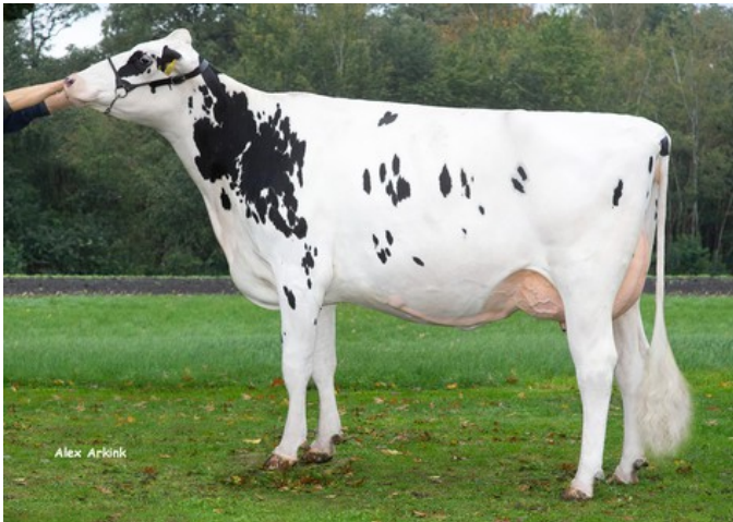
Diekers K&L DL Whiskey RDC VG-85