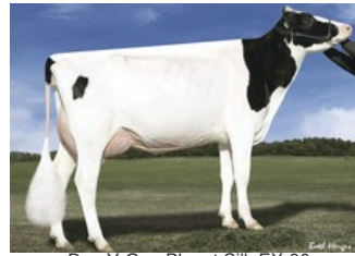
Des-Y-Gen Planet Silk EX-90