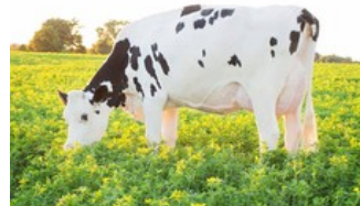
Dymentholm Sunview Sunday VG-87