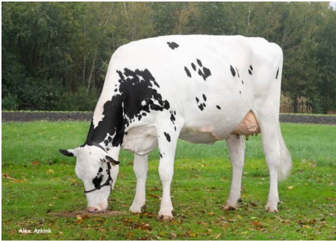
Diekers K&L DL Whiskey RDC VG-85