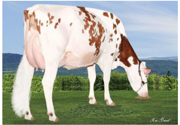
Lesperron Aikman Sofia-Red VG-87 EX-90

Forward x Crisalis RF x Rubels-Red x GP-84 Salvatore Rc x Rubicon x GP-83 Cashcoin x VG-87 Snowman x EX-90 Planet x VG-85 Bolton x VG-87 Goldwyn