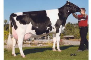
Gen-I-Beq Durham Sherry VG-87

Member PP Red x VG-87 Freestyle-Red x VG-85 AltaDateline x GP-84 Salvatore Rc x Rubicon x GP-83 Cashcoin x VG-87 Snowman x EX-90 Planet x VG-85 Bolton x VG-87 Goldwyn