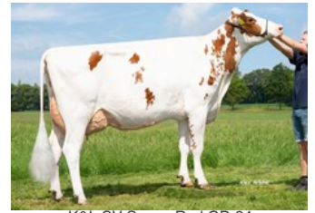
K&L SV Sunny Red GP-84