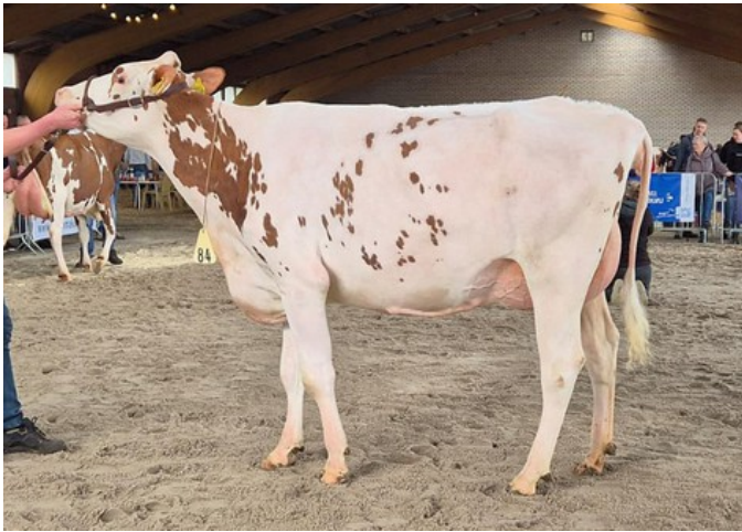
Diekers 3STAR OH Florijn VG-87