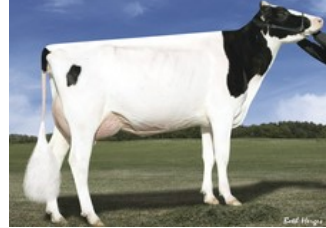
Des-Y-Gen Planet Silk EX-90