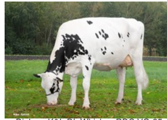
Diekers K&L DL Whiskey RDC VG-85